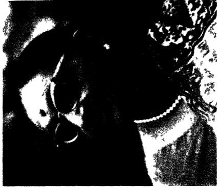
अविद्यता निवृत्ता श्रीमती रमा जन मातृश्री श्री माता गातिप्रसाद जन